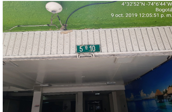
Fotografía 2: nomenclatura en fachada del predio objeto de estudio