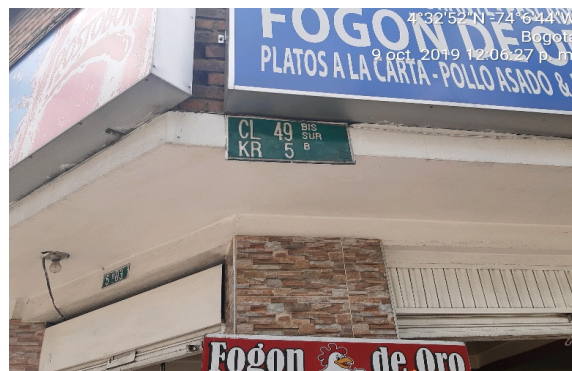
Fotografía 1: nomenclatura de fachada, predio esquinero

Como resultado de la visita técnica, se diligenció como soporte documental el acta de reunión, con el administrador del establecimiento que actualmente funciona en el predio, denominado "Restaurante y Pescadería El Sabor Pacífico" (Anexo No. 1) y se tomó en campo el siguiente registro fotográfico: