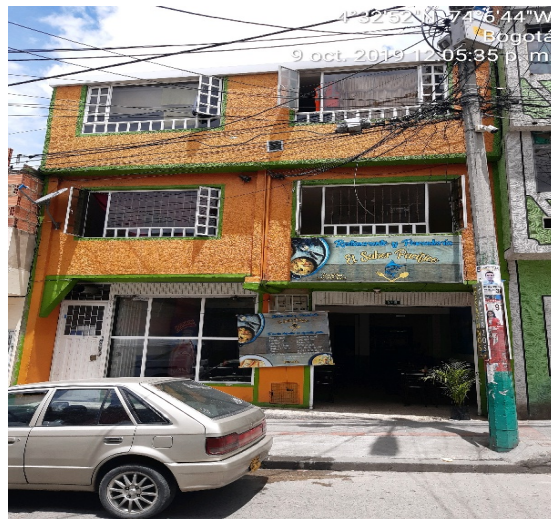
Fotografía 3: fachada del establecimiento que funciona en el predio identificado con nomenclatura Calle 49 Bis Sur No. 5B – 10

Por lo anterior, el presente memorando, es trasladado al expediente SDA-08-2018-1572 de la Dirección de Control Ambiental (DCA) para que se adelanten las acciones y trámites pertinentes a que haya lugar.